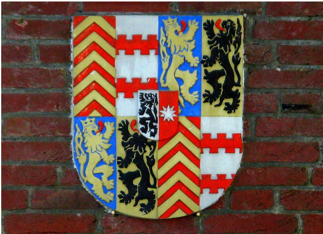
Wapen van Lamoraal, vierde graaf van Egmond (zie ook bijlage 3)