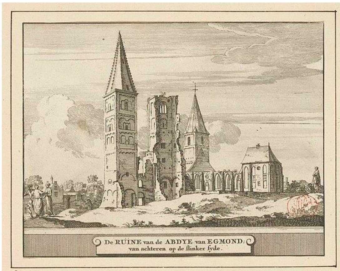
De RUINE van de ABDE van EGMOND: van achteren op de linker hyde.